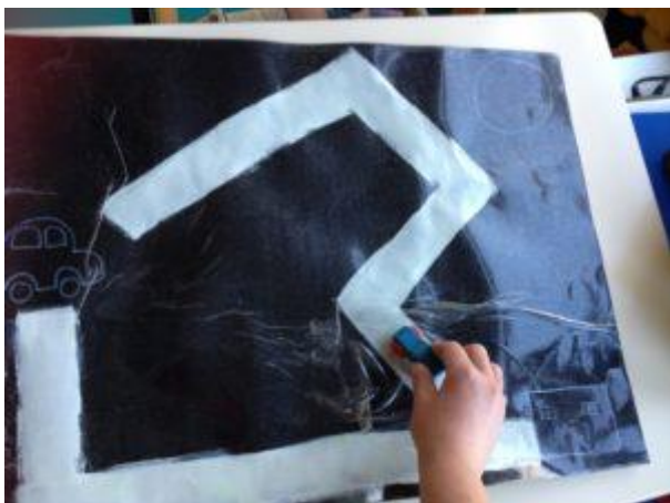
Tapis de voiture contrasté