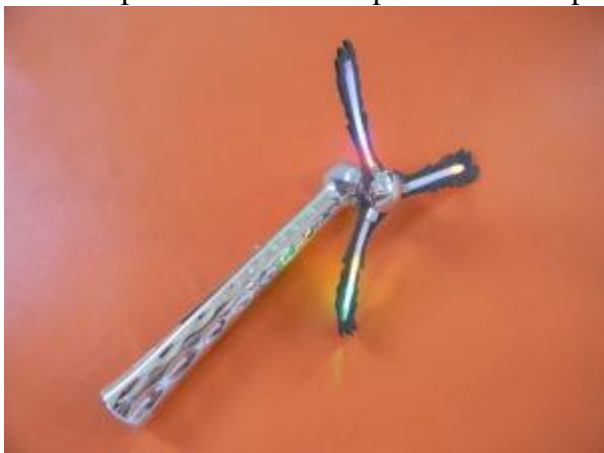
Matériel poursuite