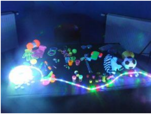
Matériel de la salle noire sous lumière fluo