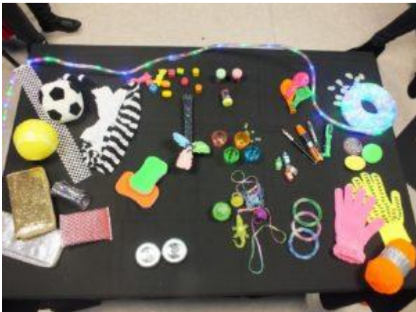
Matériel de la salle noire