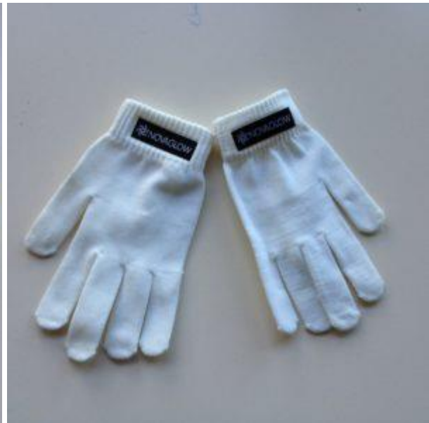
Gants fluorescents