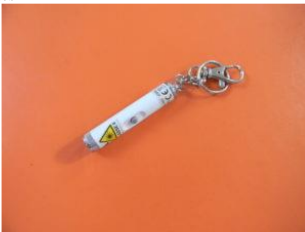
Matériel poursuite