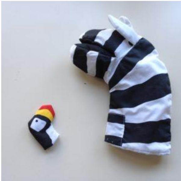
Chaussettes contrastées

Ci-dessous quelques photos illustrant la diversité des outils utilisés dans le cadre du travail autour de la poursuite visuelle.