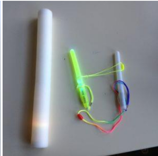
Tubes et fils lumineux